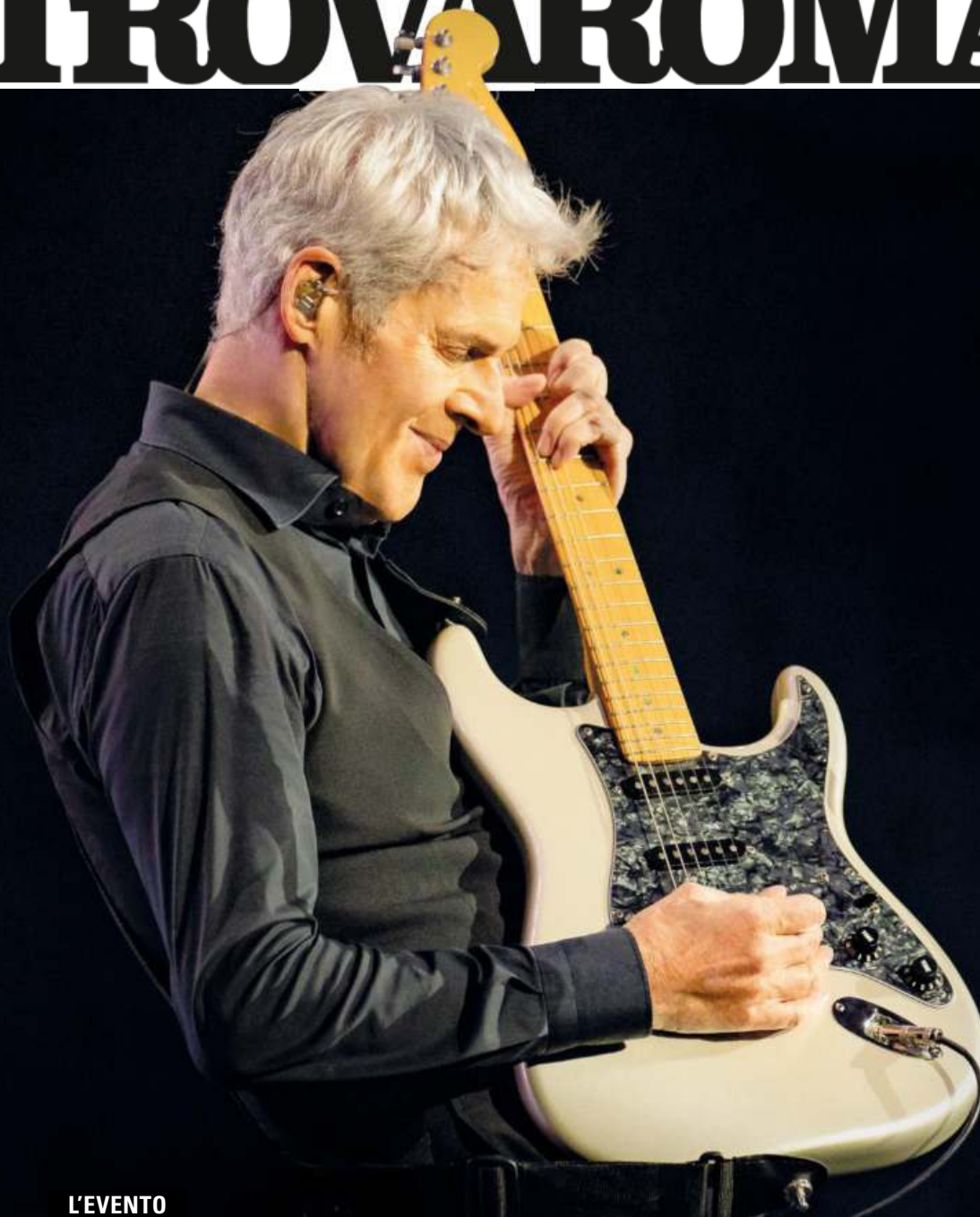
Un ritratto di Claudio Baglioni (72 anni)