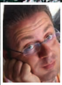
di Diego Paura

PER IL COMPLEANNO IMPORTANTE, IL CANTAUTORE SI REGALA E CI REGALA UNO SPETTACOLO DAL TEATRO DELL'OPERA. LA PASSIONE PER LA MUSICA E PER ROSSELLA SUA COMPAGNA, MANAGER E MUSA DA UNA VITA