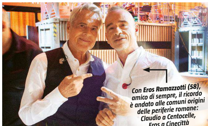
Con Eros Ramazzotti (58), amico di sempre, il ricordo è andato alle comuni origini delle periferie romane: Claudio a Centocelle, Eros a Cinecittà