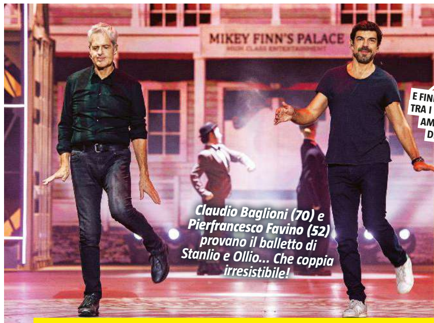
Claudio Baglioni (70) e Pierfrancesco Favino (52) provano il balletto di Stanlio e Ollio... Che coppia irresistibile!

E FINITE LE PROVE... L'ABBRACCIO TRA I DUE, CHE SONO DIVENTATI AMICI DOPO L'ESPERIENZA DI SANREMO NEL 2018