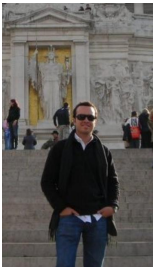
avalencia 29 anni